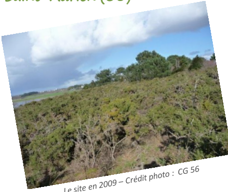
Le site en 2009