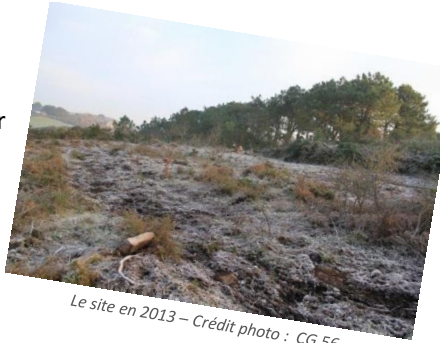
Le site en 2013